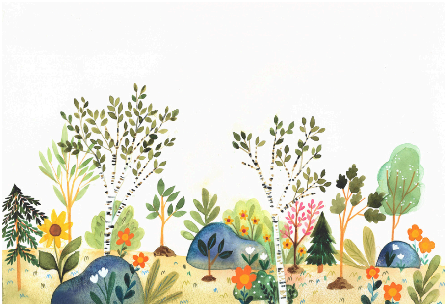
La forêt qui prend vie