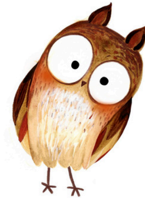
Igor le hibou